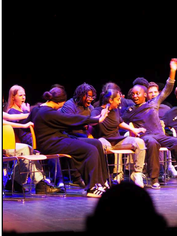
Les élèves de Agitations au Plateau dans une scène inspirée de Chamonix .