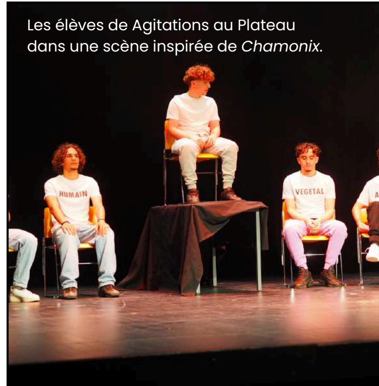
Les élèves de Agitations au Plateau dans une scène inspirée de Chamonix .

La première chose à faire dès votre arrivée à Chamonix c'est une marche de découverte. La nature est très différente, notamment les arbres qui sont de couleur bleu, les habitants de cette planète sont trop bizarres, la température varie énormément entre le jour et la nuit, le jour il fait chaud et la nuit il fait très froid. Observez comment les gens habitent leur planète ! Comme leur langue est étrange, les consonnes n'existent, et leurs comportements sont inattendus. Ils sont tous habillés pareil, ils boivent de l'eau de mer, et l'accès au transport n'est pas simple.