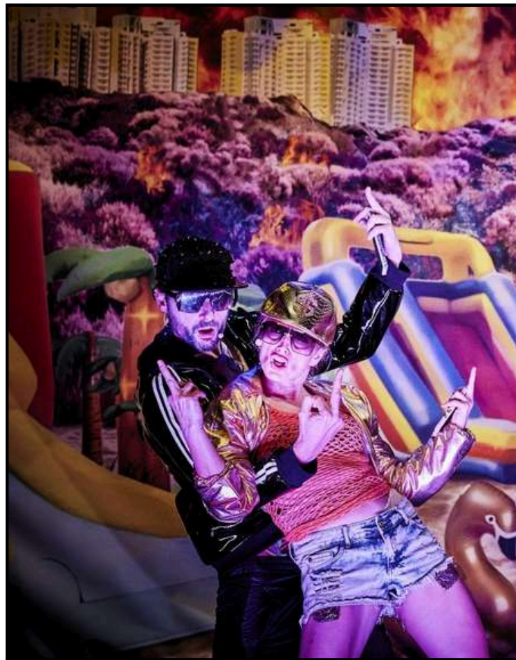
Les élèves de Agitations au Plateau dans une scène inspirée de Chamonix .